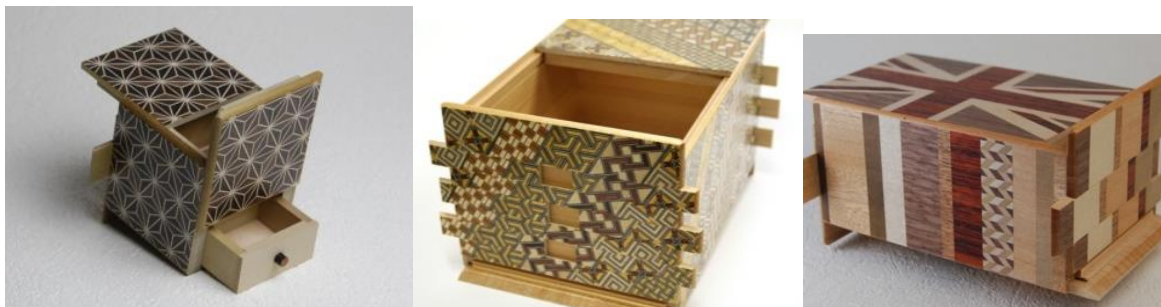
Рисунок может быть просто декоративным элементом, а может содержать в себе подсказку.

Для каждого изделия придумывается свой секрет, который нужно разгадать. Самые простые экземпляры открываются после 4-10 манипуляций. Самые сложные требуют совершения более сотни движений. Верхняя часть большинства таких шкатулок представляет собой пеструю деревянную мозаику.